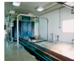
Vådum, Vaske- & svømmehaller