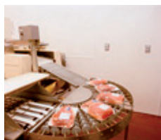
Fødevare- & levnedsmiddelindustri