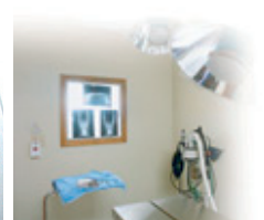
Hospitaler & laboratorier