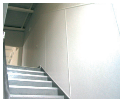
Skoler & institutioner